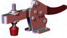
245-U Base di fissaggio piegata Braccio ad U